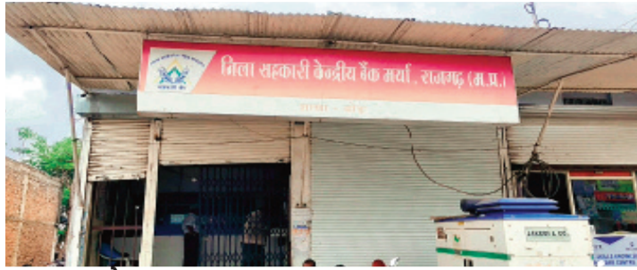
यह है पूरा मामला

ताजा मामला बोडा सोसायटी का है। बोडा शाखा के तत्कालीन प्रबंधक को 22 लाख 81 हजार 173 रूपए के गबन के मामले में कार्यवाही का नोटिस थमाया था। यह कार्यवाही आगे नहीं बढ़ी और न ही वसूली हुई। जांच को ठंडे बस्ते में डाल दिया गया। आपको बता दे की बोडा संस्था की फाइल री ओपन कर विन्दुवार जांच कराने की मांग की गई थी है। साथ ही यह भी कहा गया कि अगर पुनः जांच होती है, तो लागभग एक करोड़ रूपए का गबन का मामला सामने आ सकता है।